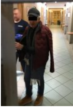
Policjant z zatrzymanym mężczyzną