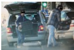
Podejrzani w trakcie przekazywania sobie przedmiotów