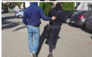
policjant prowadzi poszukiwaną