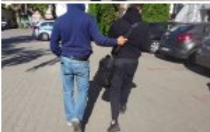
policjant prowadzi poszukiwaną