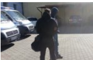
policjant z zatrzymaną kobietą