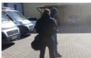
policjant z zatrzymaną kobietą