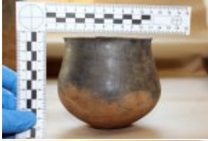
zabezpieczone przez policjantów naczynia