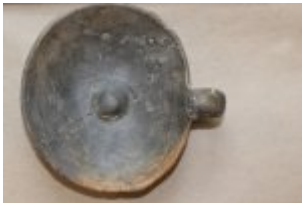
zabezpieczone przez policjantów naczynia