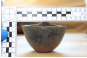
zabezpieczone przez policjantów naczynia