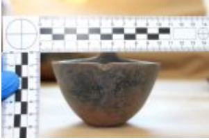
zabezpieczone przez policjantów naczynia