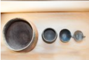
zabezpieczone przez policjantów naczynia