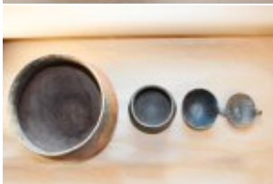
zabezpieczone przez policjantów naczynia