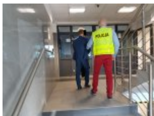
Mężczyzna podejrzany o oszustwo