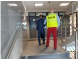
Mężczyzna podejrzany o oszustwo