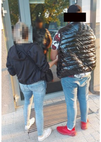
Policjantka z zatrzymanym mężczyzną