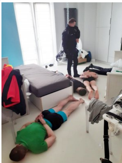
Policjanci z zatrzymanymi mężczyznami