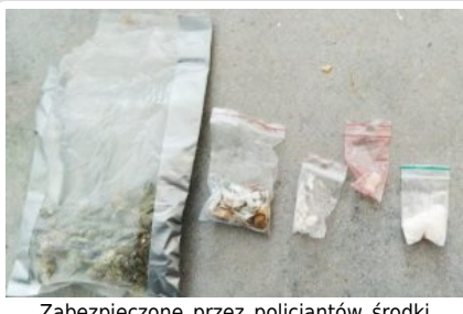
Zabezpieczone przez policjantów środki odurzające