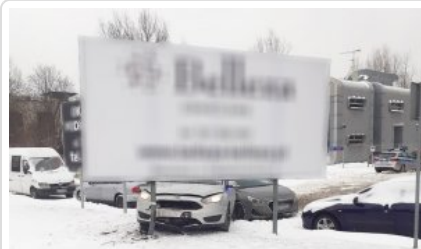
Zabezpieczony przez policjantów ford z narkotykami