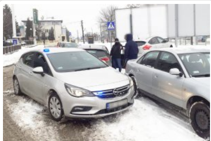
Policyjne działania na miejscu zatrzymania podróżujących fordem z narkotykami