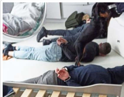
Policjanci z zatrzymanymi mężczyznami